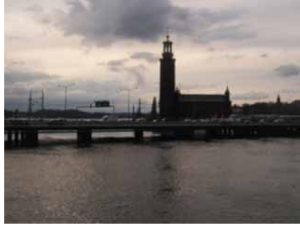
Nobel ödülleri verildiği Stockholm Belediye Sarayı

Kahvaltıdan sonra Stockholm’deki okullara eğitim ziyaretimiz başlıyor. Okul ziyaretlerinde fotoğraf çekmek için okul yönetiminden izin almak gerekiyor. Fotoğraf çekimleri ise sadece mekânlarla sınırlı kalabiliyor, öğrencilerin fotoğraflarının çekilmesine izin verilmiyor. Söz