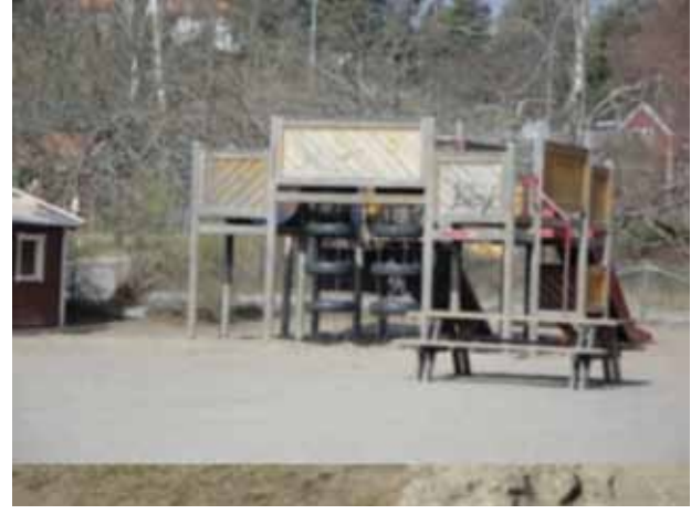
Stenmoskolan – Okul Bahçesi

Okulun bahçesinde araba lastiğinden salıncaklar, yine araba lastiklerinden oyun alanları, kulübecikler, kumdan oyun alanları var. Çocuklar gruplar hâlinde bahçedeki bu oyun alanlarında oynuyorlar ve hiçbir çocuk diğer bir çocukla kavga etmiyor veya biri diğerini itelemiyor. Teneffüs saatlerinde de kimse birbirini itelemeden, koşuşturmadan dışarı çıkıyor. Bunun nedenini öğretmene sorduğumuzda -onlar için tam tersi bir durum, yani çocukların koşarak ve birbirini iteleyerek teneffüse çıkması tuhaf olsa gerek ki -öğretmen soruyu anlamlandıramamış bir beden diliyle "Neden öyle davranırsınlar