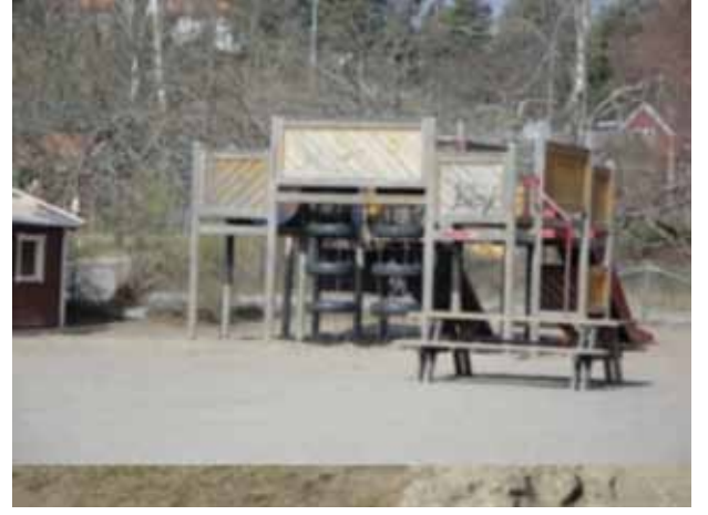
Stenmoskolan – Okul Bahçesi

Okulun bahçesinde araba lastiğinden salıncaklar, yine araba lastiklerinden oyun alanları, kulübecikler, kumdan oyun alanları var. Çocuklar gruplar hâlinde bahçedeki bu oyun alanlarında oynuyorlar ve hiçbir çocuk diğer bir çocukla kavga etmiyor veya biri diğerini itelemiyor. Teneffüs saatlerinde de kimse birbirini itelemeden, koşuşturmadan dışarı çıkıyor. Bunun nedenini öğretmene sorduğumuzda -onlar için tam tersi bir durum, yani çocukların koşarak ve birbirini iteleyerek teneffüse çıkması tuhaf olsa gerek ki -öğretmen soruyu anlamlandıramamış bir beden diliyle “Neden öyle davranırsınlar