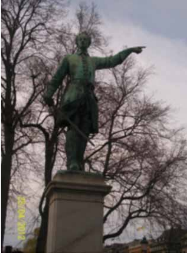
12. Karl'ın Heykeli (Demirbaş Şarl)

diplomaları verilirken isim isim çağırılmıyor ve sahneye grup olarak davet ediliyor. Öğrenciler, kendilerini değersiz hissetmelerine neden olan bu uygulamadan dolayı ombudsmana başvuruyorlar. Aslında okulun herhangi bir art niyeti olmadığı, o anda ellerinde sınıf listesi olmadığı için böyle bir çözüm üretildiği tespit edilmiş olmasına rağmen, önemli olanın niyet değil sonuç olduğu söyleniyor ve engelli öğrencileri sahneye grup olarak davet etmenin dışında, o sınıfın öğretmeninin öğrencilerin isimlerini okuması gibi çözümlerin de olması nedeniyle okula ceza verilmesine karar veriliyor.