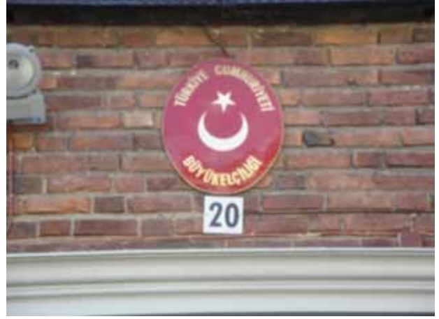
Stocholm Türk Büyükelçiliği-Eğitim Müşavirliği

Parlamento insan hakları komisyonu üyesi iktidar partisinden (koalisyon hükûmeti) üç milletvekili ve muhalefet partisinden bir milletvekili olmak üzere dört milletvekili ile bir toplantı yapıldı. Okullarda demokratik eğitimin gerekli olduğu konusunda, iktidar ve muhalefet partisi de hemfikir. Eğitimle ilgili büyük kararların alınmasında iktidar ve muhalefet partilerinin uzlaşması önemli. Bu nedenle alınacak kararlarla ilgili iktidar partisi muhalefet partisiyle paylaşımlarda bulunuyor. Ayrıca hükûmet değişikliklerinde eğitim politikasının devamlılığının sağlanmasının önemli olduğu vurgulanıyor Uluslararası sınav sonuçları eğitim politikalarının belirlenmesinde oldukça etkili. İsveç'in uluslararası sınavlardaki (PISA, TIMSS ve PIRLS) başarısı ise