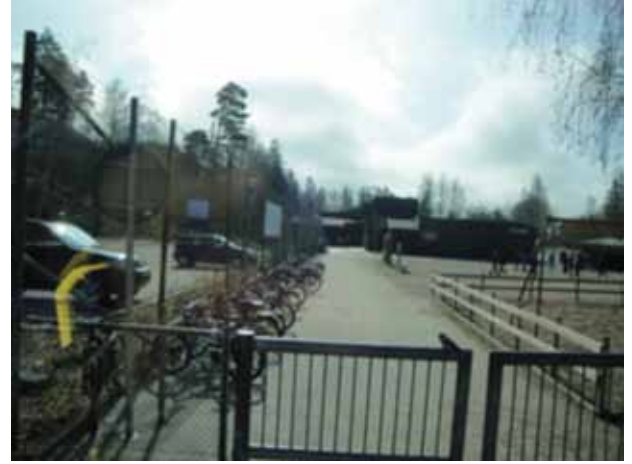
Stenmoskolan- Tellerle Çevrili Okul Bahçesi

Bizde de semt kütüphaneleri açılarak buraları hem öğrencilerin hem de yetişkinlerin işlevsel olarak kullanmaları sağlanmalıdır. Böyle bir uygulama, okuyan bir toplum olmak için etkili çözümlerden biri olabilir. Ayrıca okul kütüphaneleri de daha işlevsel hâle getirilmelidir.