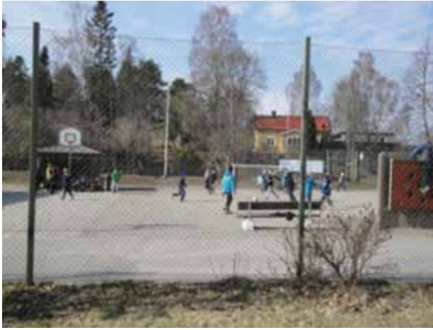
Stenmoskolan- Tellerle Çevrili Okul Bahçesi

okullarda, okulun çevreyle iletişimini kesecek yüksek duvarlar bulunmuyordu. Ziyaret edilen okullardan birinin etrafı tellerle çevrilmiş, ama bu durum dış çevreyle iletişime engel teşkil etmiyordu.