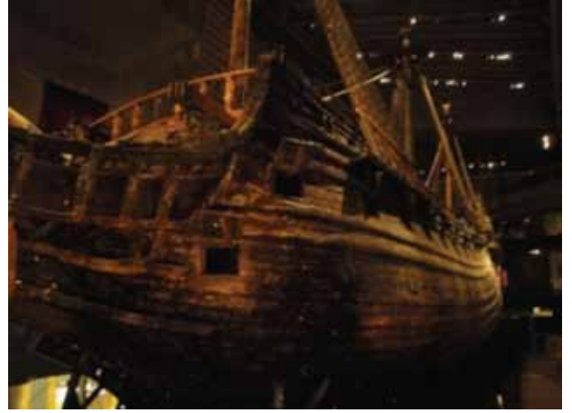
300 yıl denizin altında kaldıktan sonra çıkarılan "Vasa" savaş gemisi

Ombustmanlık sisteminin başka ülkelerde de olup olmadığı konusunda merakımı gidermek amacıyla yaptığım araştırmada aslında bu yapının Osmanlı'daki yargı kurumundan (hisbe) esinlenerek İsveçliler tarafından kurulduğu, ora-