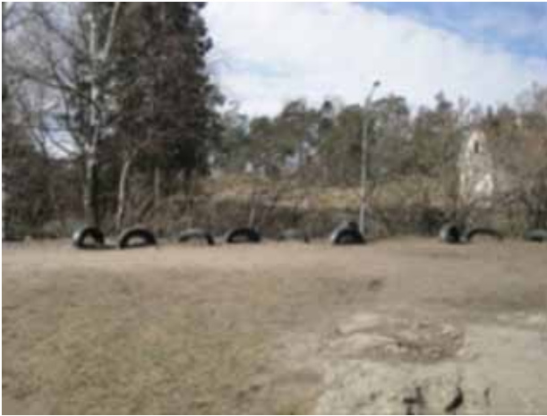
Stenmoskolan – Okul Bahçesi

Öğrenciler okula geldiklerinde okul binasının kapısını kilitli bulmuyorlar ya da okul binasının girişinde nöbet bekleyen bir görevli yok. Okula gelen sınıfa giriyor ve dersin başlamasından önceki 20 dakikada, ders başlayana kadar kitabını okuyor.