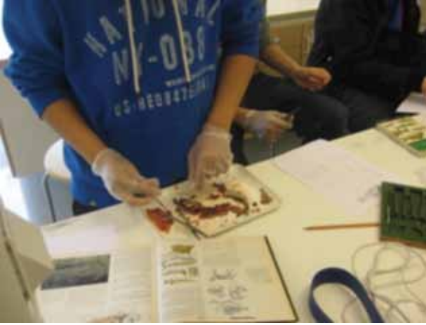
Uygulamaya Yönelik Bir Ders

psiko-motor becerilerinin geliştirilmesine önem veriliyor.