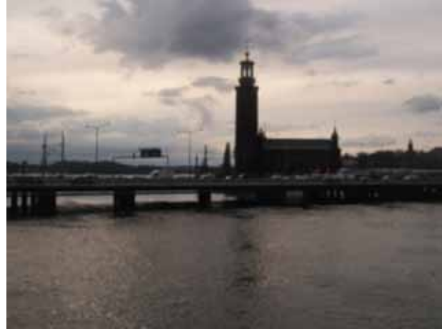
Nobel ödülleri verildiği Stockholm Belediye Sarayı

Kahvaltıdan sonra Stockholm’deki okullara eğitim ziyaretimiz başlıyor. Okul ziyaretlerinde fotoğraf çekmek için okul yönetiminden izin almak gerekiyor. Fotoğraf çekimleri ise sadece mekânlarla sınırlı kalabiliyor, öğrencilerin fotoğraflarının çekilmesine izin verilmiyor. Söz