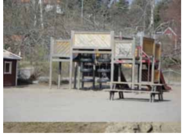
Stenmoskolan – Okul Bahçesi

Okulun bahçesinde araba lastiğinden salıncaklar, yine araba lastiklerinden oyun alanları, kulübecikler, kumdan oyun alanları var. Çocuklar gruplar hâlinde bahçedeki bu oyun alanlarında oynuyorlar ve hiçbir çocuk diğer bir çocukla kavga etmiyor veya biri diğerini itelemiyor. Teneffüs saatlerinde de kimse birbirini itelemeden, koşuşturmadan dışarı çıkıyor. Bunun nedenini öğretmene sorduğumuzda -onlar için tam tersi bir durum, yani çocukların koşarak ve birbirini iteleyerek teneffüse çıkması tuhaf olsa gerek ki -öğretmen soruyu anlamlandıramamış bir beden diliyle “Neden öyle davranırsınlar