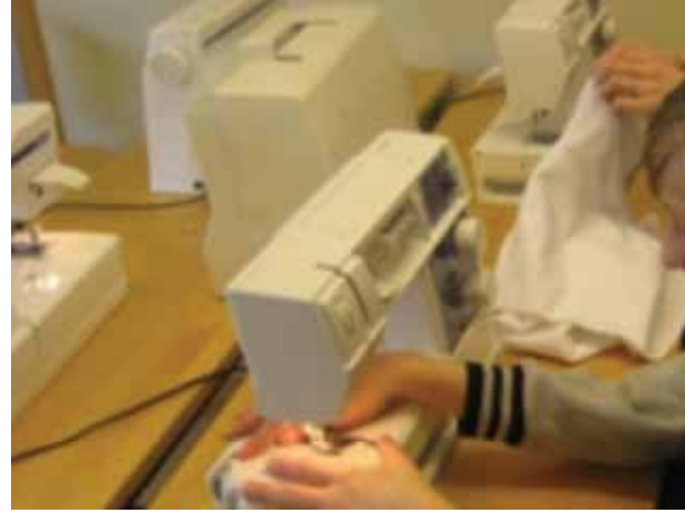
El Becerisine Yönelik Bir Ders

Öğrenciler 'öğretmenim' ya da 'hocam' hitaplarını kullanmıyorlar, öğretmenleri adlarıyla çağırıyorlar. Öğrenciler ve öğretmenler de kıyafet konusunda serbestler. Dışarıdan bir misafi-