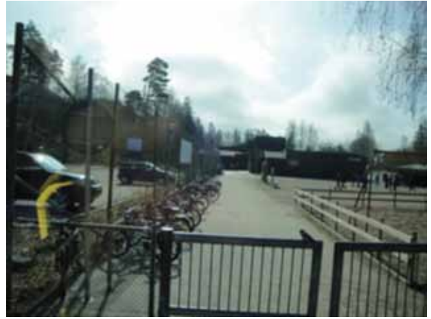
Stenmoskolan- Tellerle Çevrili Okul Bahçesi

Bizde de semt kütüphaneleri açılarak buraları hem öğrencilerin hem de yetişkinlerin işlevsel olarak kullanmaları sağlanmalıdır. Böyle bir uygulama, okuyan bir toplum olmak için etkili çözümlerden biri olabilir. Ayrıca okul kütüphaneleri de daha işlevsel hâle getirilmelidir.