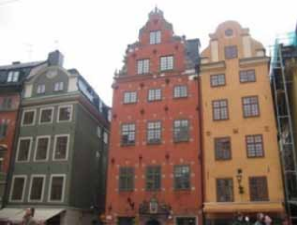
Gamla Stan- Stocholm

kaların bulunduğu sanayi bölgesinden geçiyoruz. Yorucu bir günün ardından nihayet beş gün boyunca konaklayacağımız “Grand Scandic Otel”e ulaşıyoruz. Otelin en belirgin özelliklerinden biri, odaların oldukça küçük olması. Bu odaları, eğitim ziyaretinin hemen öncesinde Marmara Üniversitesinde düzenlenen sempozyum nedeniyle İstanbul’da konakladığımız oteldeki odalarla kıyaslamak mümkün değil elbette. Kıyafetleri koymak için dolap da yok, duvara monte edilmiş askılar var. Ama genel olarak iyi bir otel olduğunu söylemek mümkün. Ertesi sabah kahvaltıya indiğimizde İsveçlilerle kahvaltılıkültürümüzün de farklı olduğunu görüyoruz. Zeytin ve beyaz peynir onların kahvaltı münülerinde yer almıyor maalesef. Bir şeyin kıymeti yokluğunda anlaşılırmış ya hani. Biz de orada kahvaltı soframızın olmazsa olmazı zeytinin ve beyaz peynirin kıymetini anlamış bulunuyoruz.